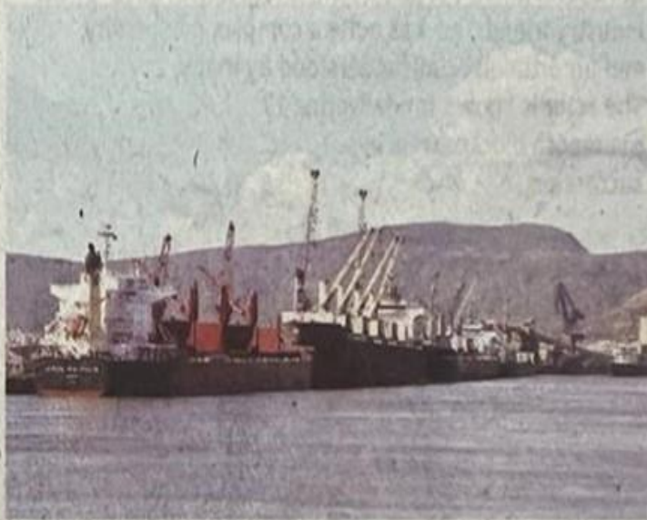
Ships anchored at the port

VISAKHAPATNAM Port Authority (VPA) handled the highest single-day volume of cargo.