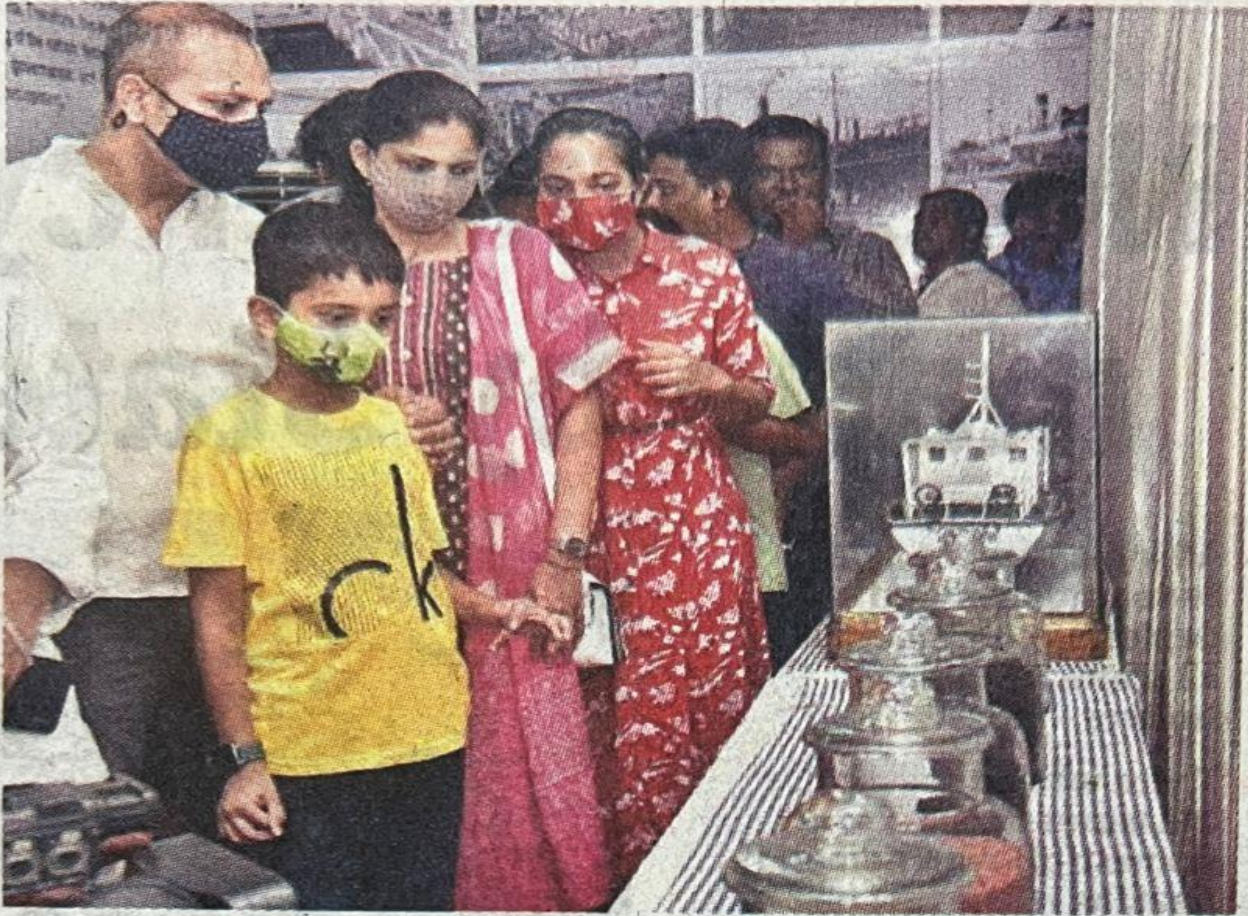
Visitors browsing through the exhibits of VPA in Visakhapatnam on Tuesday